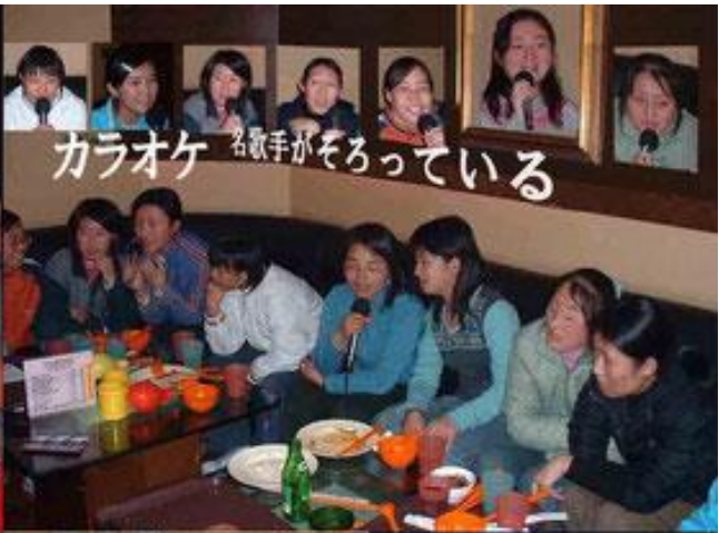
カラオケ 名歌手がそろっている