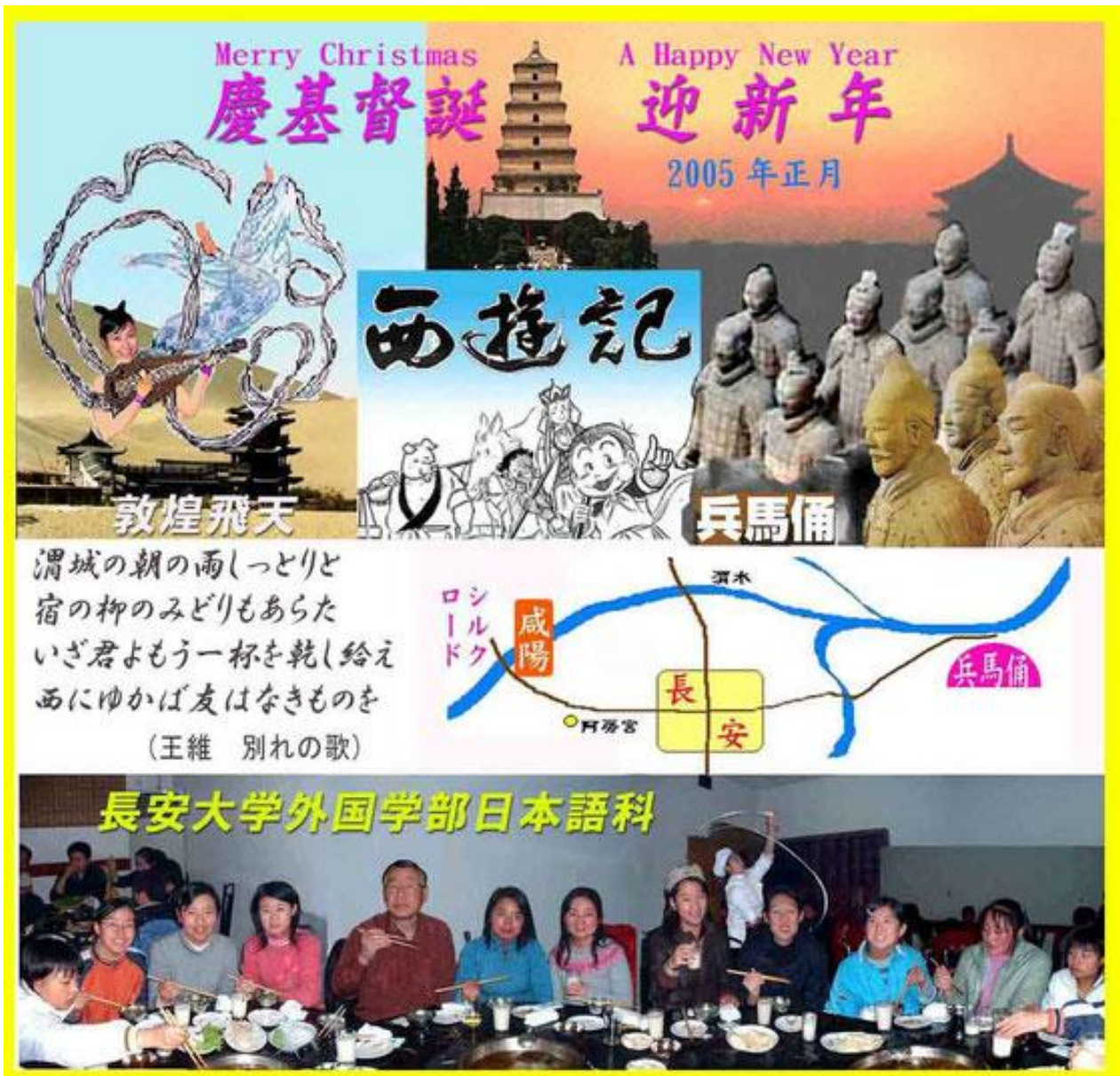
日本語教師として若者と共に楽しく生活。そして、長安の都をめぐる観光！ 作为日语教师，我跟年轻人一起生活得很愉快。并且，我游览了长安都的旅游胜地。