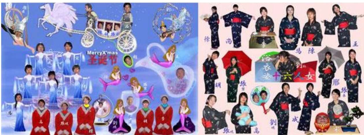
学生と教師をモデルにしたクリスマスカード 以学生和老師為原型主題的聖誕卡片。