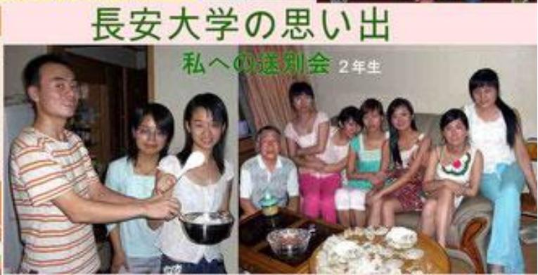
長安大学の思い出