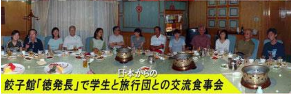
日本からの餃子館「徳発長」で学生と旅行団との交流食事会