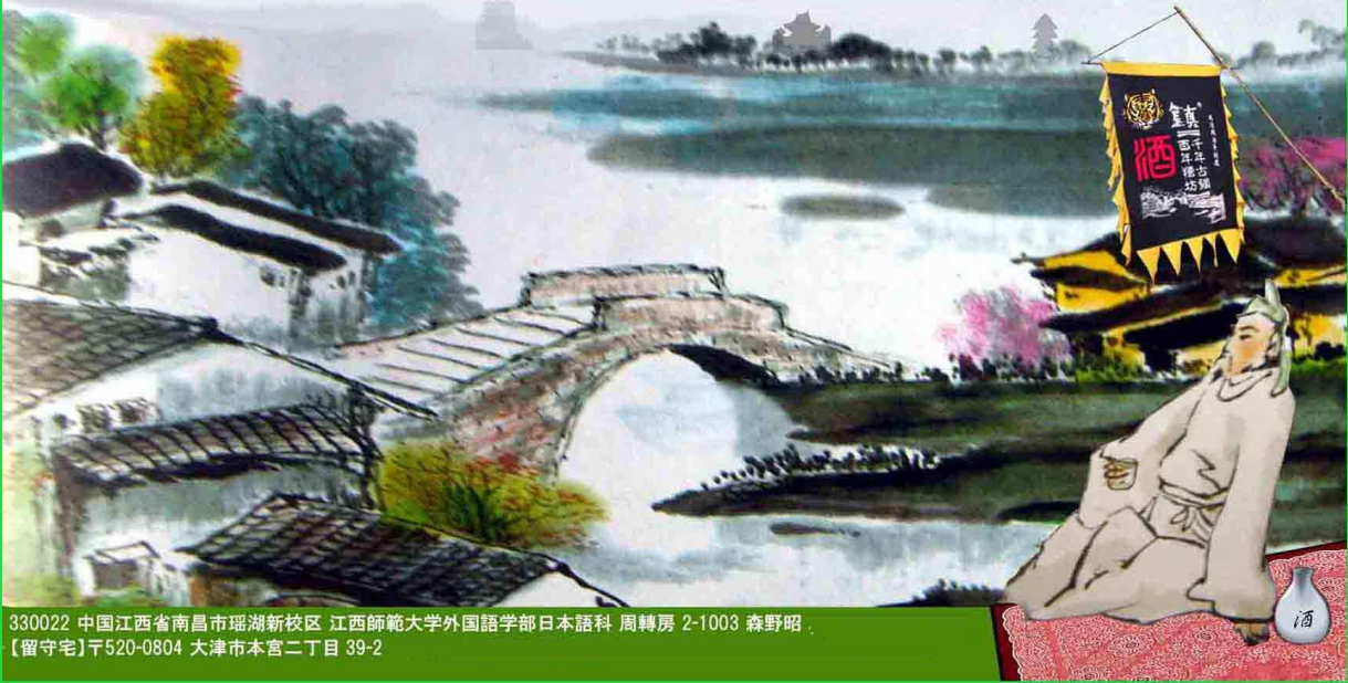
330022 中国江西省南昌市瑶湖新校区 江西師範大学外国語学部日本語科 周轉房 2-1003 森野昭、 【留守宅】〒520-0804 大津市本宮二丁目 39-2

中国で日本語教師を始めて、はや6年目を迎え、現在は南昌市で教えております（昭）。仲間と山登りをするのが趣味です（美知子）。