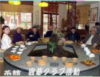
茶館 囲碁クラブ活動